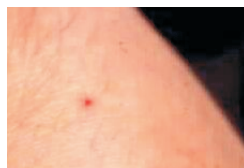
Abb. 4 Zeckenstich mit initialer Lokal- reaktion: keine Borrelieninfektion

Die ersten klinischen Symptome werden zumeist an der Haut bemerkt. Typisch ist die Wanderröte (Erythema migrans, EM).