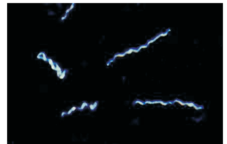
Abb. 1 Borrelien im Dunkelfeld

Die Lyme-Borrelien haben ihren natürlichen Wirt in Zecken, und zwar sowohl in jugendlichen wie auch in den erwachsenen Entwicklungsstufen (Larven, Ny-