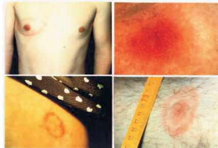
Abb. 5 Erythema migrans

Häufige Ausgangspunkte sind Gesäß- und Leistenbereich, Bauchnabel, Schulter und behaarter Kopf.