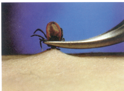
Abb. 9 Entfernen einer Zecke mittels

erst relativ spät nach dem eigentlichen Stich statt, wenn sich das Tier bereits mit Blut ziemlich vollgesogen hat. Wird eine Zecke am Körper bemerkt, sollte sie deshalb so schnell wie möglich durch vorsichtigen Zug entfernt werden, ohne sie zu quetschen und damit die evtl. vorhandenen Borrelien erst selbst in den Stichkanal auszudrücken. Vorheriges Betropfen der Zecke mit Öl, Nagellack o. ä. sollte keinesfalls durchgeführt werden: es kann zum Absterben der Zecke führen und eine Borrelienübertragung sogar begünstigen. Zum Extrahieren der Zecke sollte man sie vorsichtig ganz nahe an der Haut z. B. mit einer speziellen Zeckenpinzette fassen und kontinuierlichen Zug ausüben, bis sie loslässt.