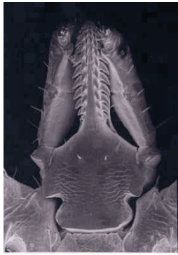
Abb. 3 Stichwerkzeug unter dem Raster- Elektronen- mikroskop

Zecken auf der Haut auch immer sofort und ohne weitere Verzögerung entfernt werden! In Europa übertragen die gleichen Zecken neben der Borreliose auch den Erreger der Frühsommer Meningoenzephalitis (FSME). Während Borrelien bundesweit angetroffen werden, beschränkt sich die FSME auf eine relativ kleine, aber wachsende Zahl süddeutscher Bezirke und Landkreise, sogenannte Endemiegebiete. Weitere, ebenfalls durch Zecken übertragbare Krankheiten wie die Tularämie, die Humane Granulozytäre Ehrlichiose (HGE) und die Babesiose spielen in Deutschland nur eine sehr untergeordnete Rolle.