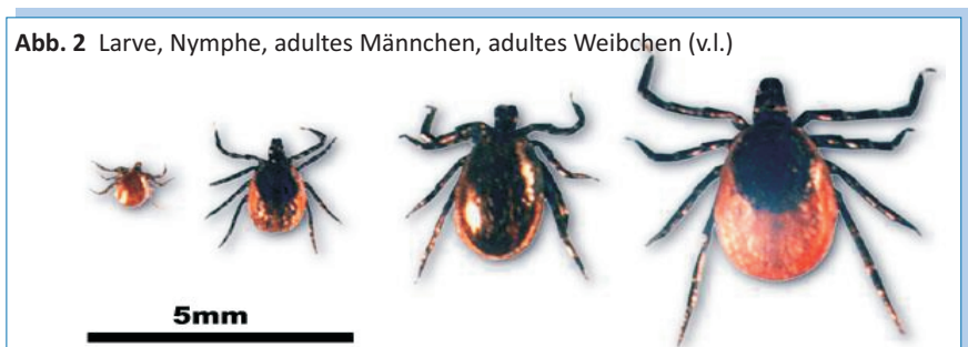
Abb. 2 Larve, Nymphe, adultes Männchen, adultes Weibchen (v.l.)

mphen und Adulte). In Europa handelt es sich dabei ganz vorwiegend um den „Gemeinen Holzbock“ ( Ixodes ricinus ), in den USA die verwandten Arten I. dammini und I. scapularis . Die Zecken benötigen zu ihrer Fortpflanzung und Entwicklung fremdes Blut. Dieses saugen sie aus den Hautkapillaren gestochener Mäuse und anderer Kleinnager, aber auch großer Warmblüter wie Rehe, Hirsche oder eben auch Menschen. Die Borrelien halten sich u. a. im Verdauungstrakt und den Speicheldrüsen der Zecken auf und können beim Stich auf die Warmblüter übertragen werden. Interessanterweise findet diese Übertragung meist nicht direkt zu Beginn des Saugaktes statt, sondern erst nach 24 Stunden oder noch später. Deshalb sollten zufällig entdeckte