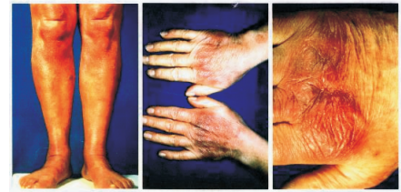
Abb. 7 ACA-Erscheinungsformen

Bei weitem nicht jede Infektion durchläuft die späteren Stadien, die überwiegende Mehrheit kommt auch unbehandelt bereits vorher zum Stillstand. Gelegentlich werden aber auch Spätmanifestationen beobachtet, ohne dass es zuvor zu einem Erythema migrans ge-